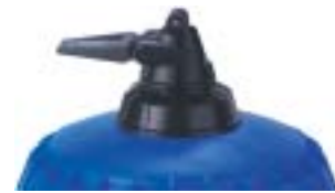
Встроенный байпас: Система запуска (on) и остановки (off) всасывания продукта.

Предлагаемые опции позволяют лучше адаптировать дозатор к вашим needs. Обоснованность их применения определяется с помощью наших технических отделов.